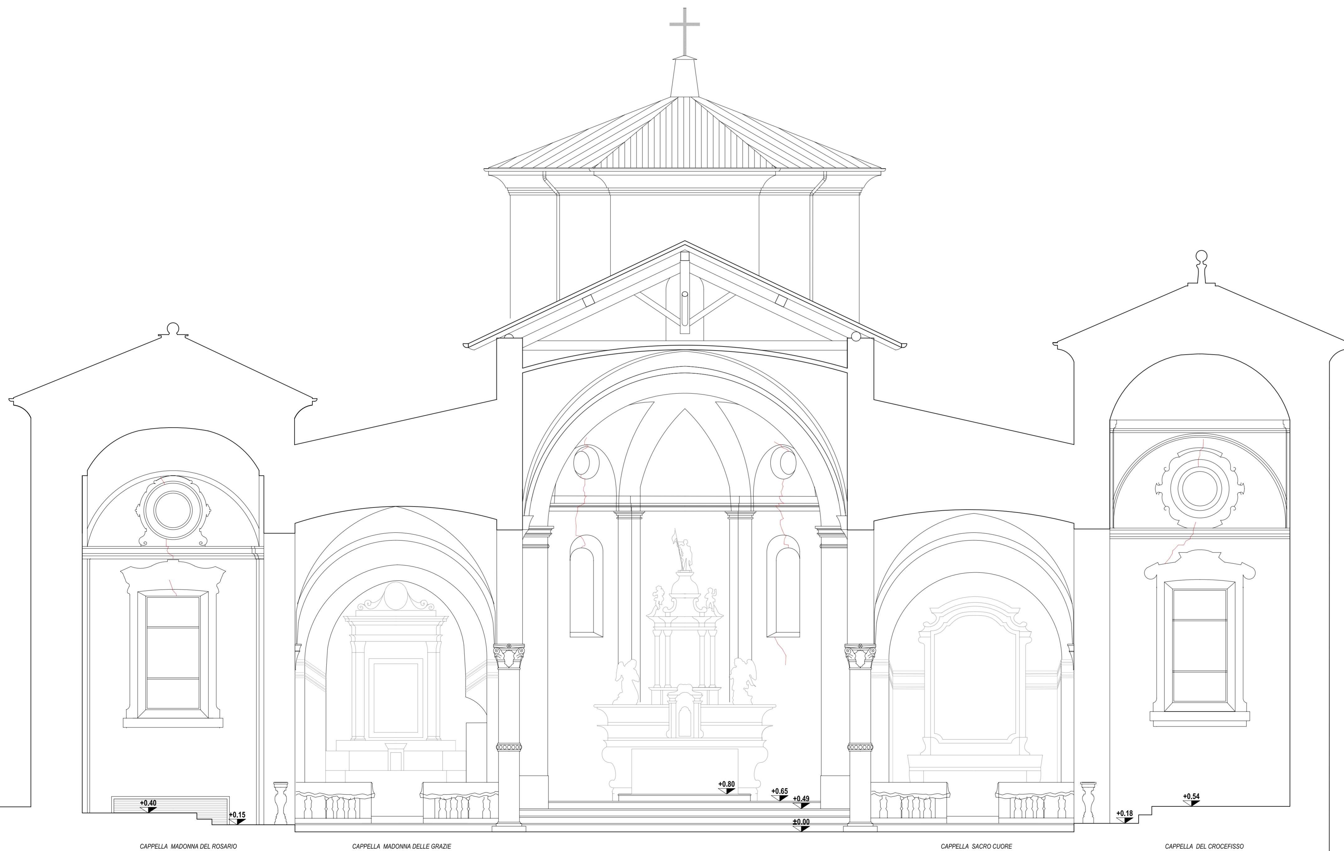
STATO DI FATTO SEZIONE B-B