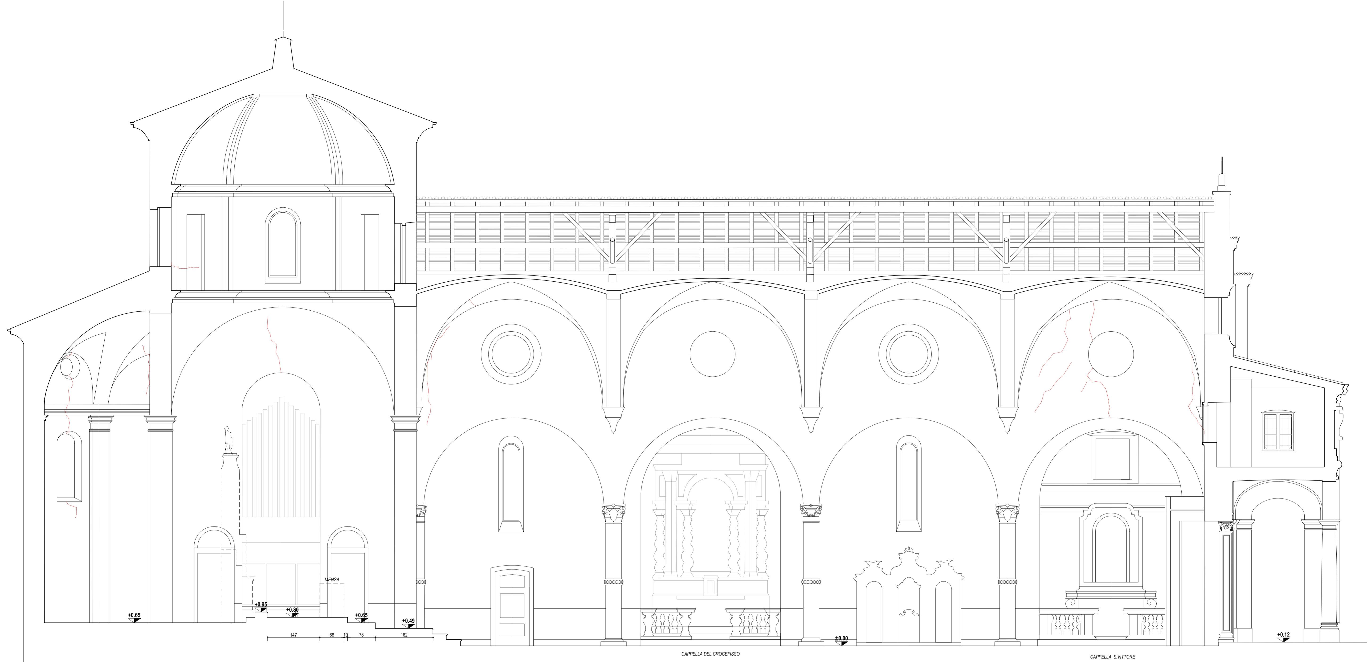
STATO DI FATTO SEZIONE A-A